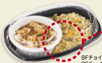
BFチョイス10黒 BFチョイス10嵌合蓋 BFカレー内2ホワイト BFカレー内2嵌合蓋U字穴