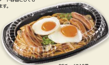
BFチョイス10黒 BFチョイス10浅嵌合蓋